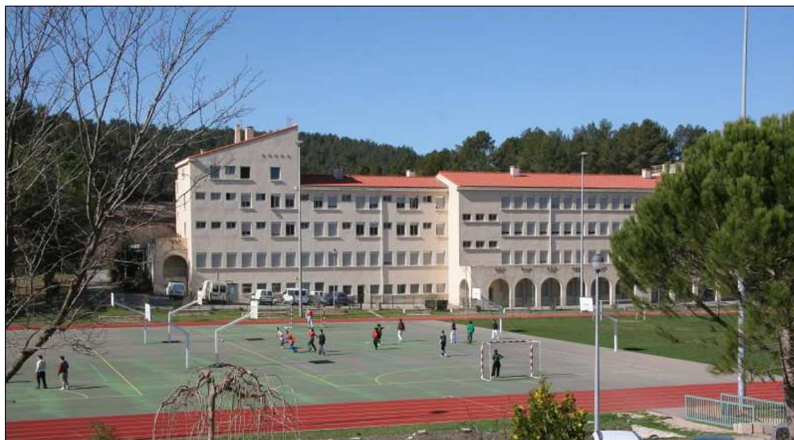
Site du LEGTA Aix Valabre.